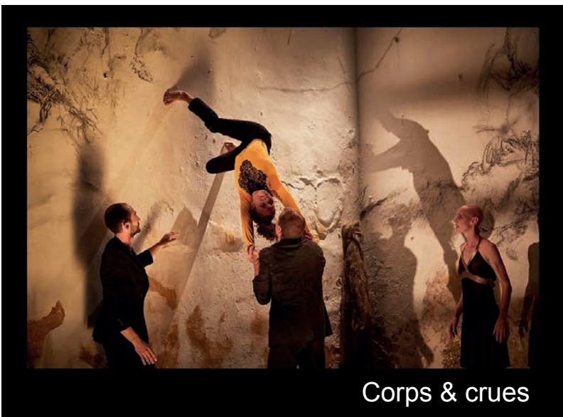
Corps & crues