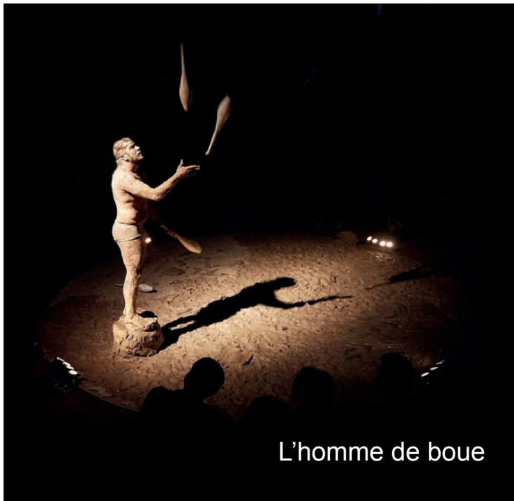
L'homme de boue